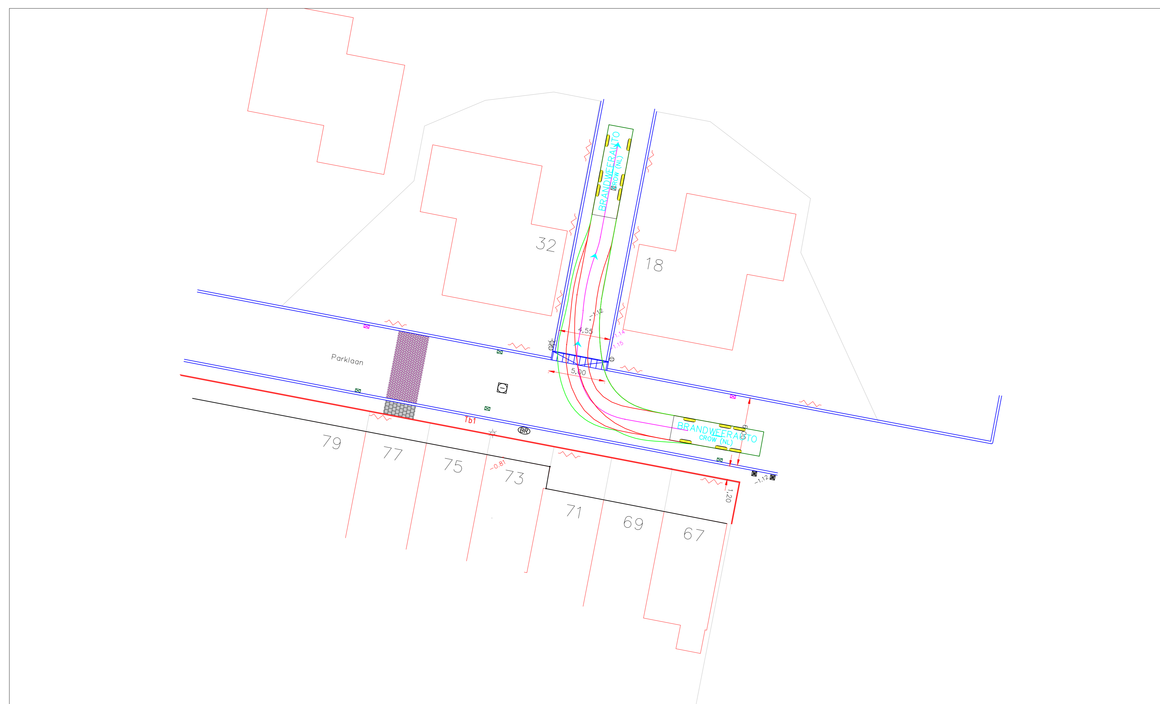
Curve 1- Rechts in