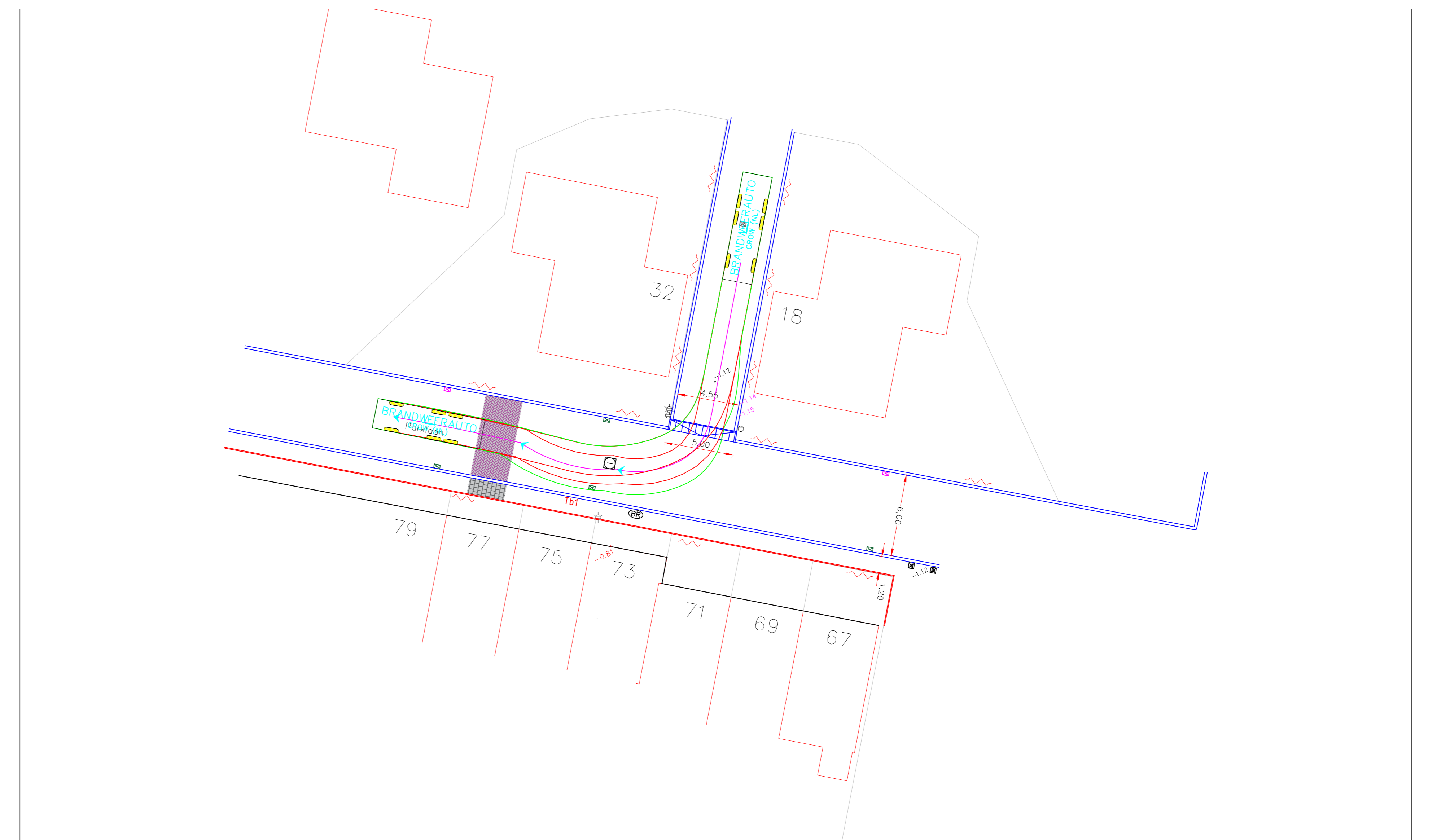
Curve 4- Links uit